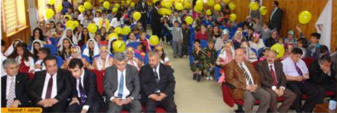
Hayatın 1. sınıfı